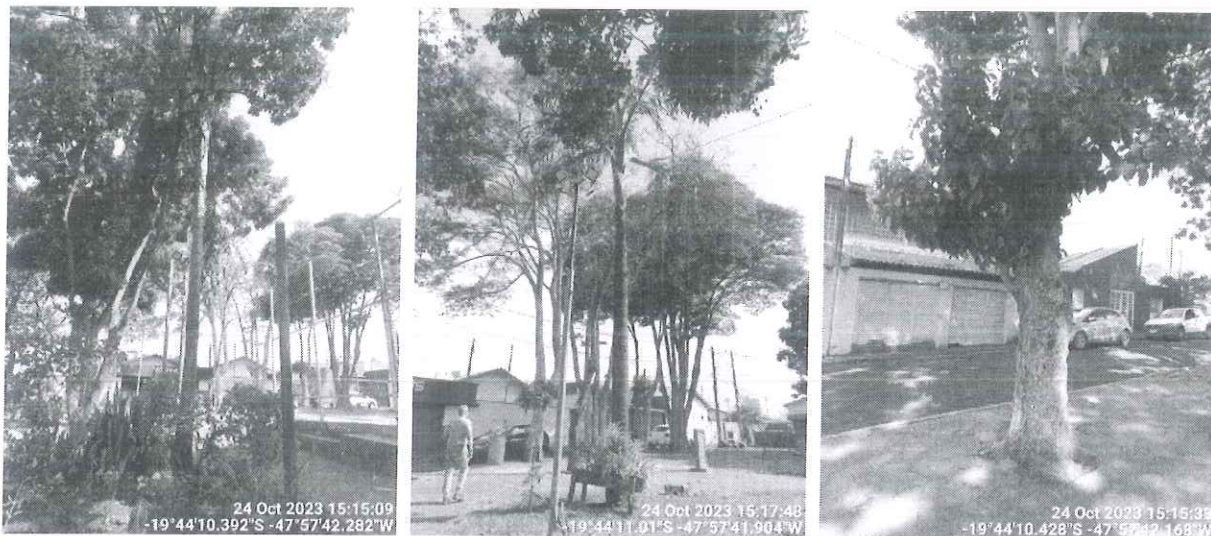
Figura 1 – Vista dos espécimes que necessitam do manejo de supressão e poda.

Diante disso, encaminhamos a presente solicitação para a Secretaria de Serviços Urbanos e Obras (SESURB) para conhecimento e providências.